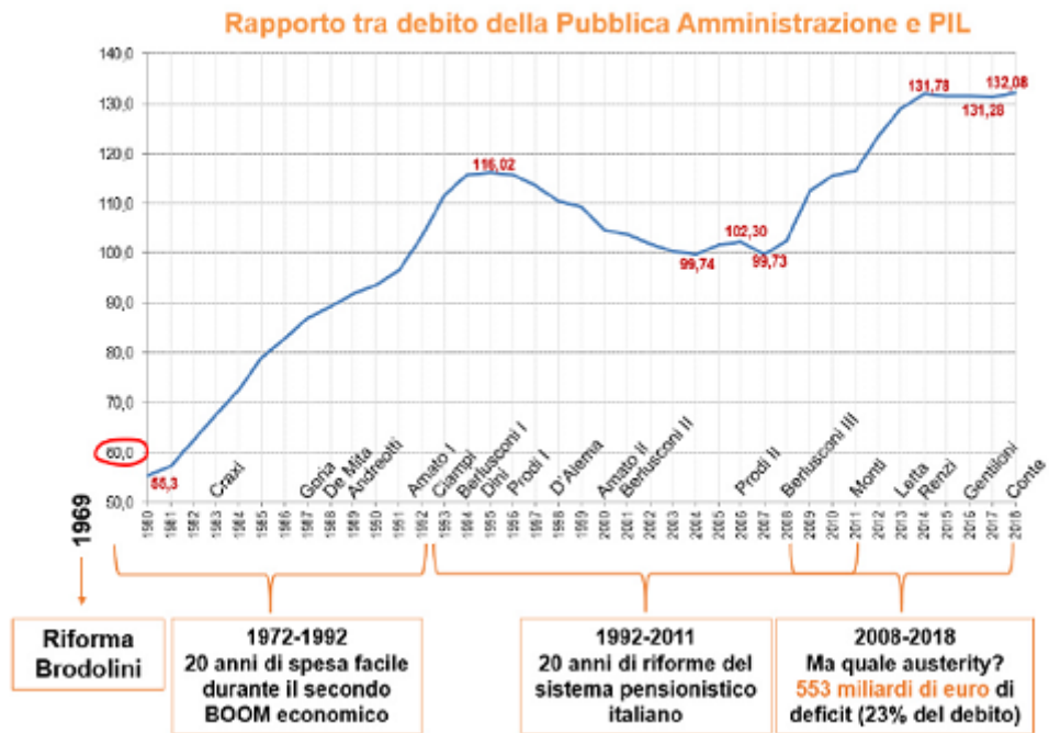
Figura I.1 - Andamento del rapporto tra debito pubblico e PIL dal 1980 a oggi

La nostra classe politica, prima di sparare scemenze, dovrebbe studiare questi dati parlando anche, e soprattutto, di doveri.